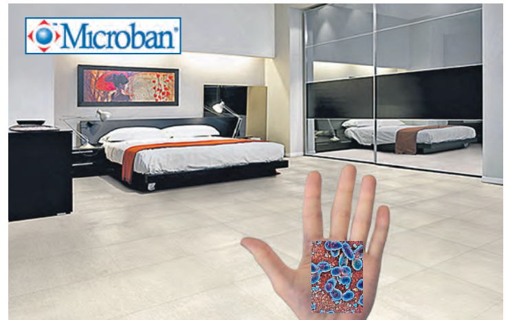
Der antibakterielle Schutzschild von Microban schützt die Fiordo-Fliesen vor Bakterien – allein auf einer Hand befinden sich Milliarden der gefährlichen Erreger.

Das Unternehmen ist weltweit führend beim aktiven Hygieneschutz – unter anderem kommen die mehr als 20 unterschiedlichen, antibakteriellen Technologie-Systeme von Microban in den Produkten so namhafter Fir-